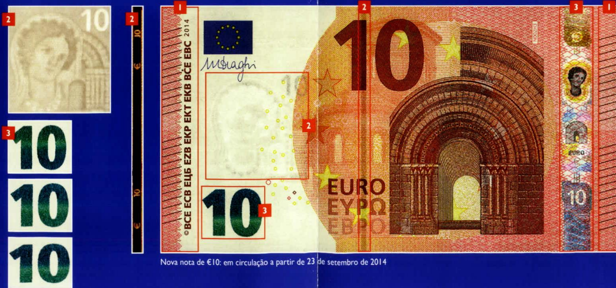
Nova nota de €10: em circulação a partir de 23 de setembro de 2014