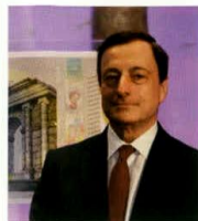
Mario Draghi Presidente do Banco Central Europeu

Desde a sua entrada em circulação em 2002, as notas de euro tornaram-se num dos meios de pagamento mais fiáveis do mundo. Para manter essa confiança, a série "Europa" beneficia dos mais recentes avanços na tecnologia de produção de notas.